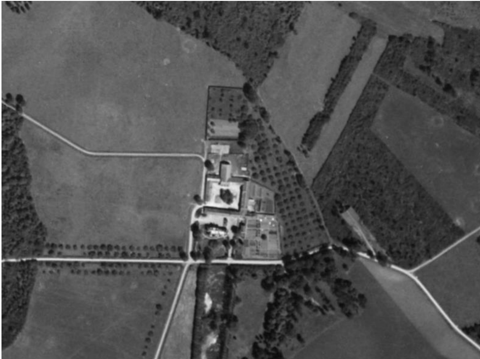
Figure 11 : La Ferme des Vanneaux en 1949