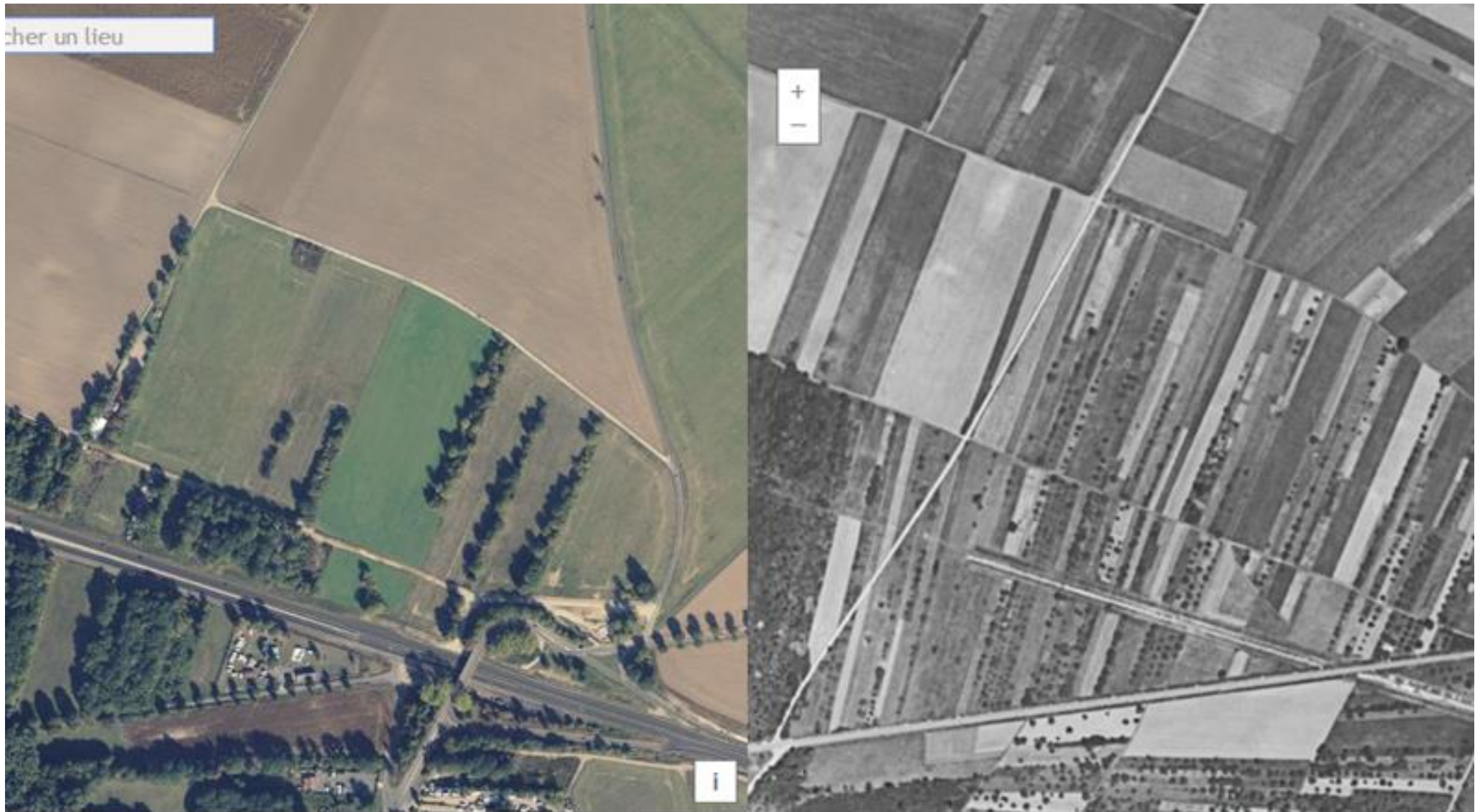
Figure 9 : Les Coutumes de Presles en 1949 et en 2018