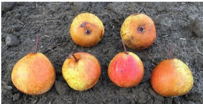
Figure 5 : « Baptisto »

Découverte vers 1760 par le curé de Villiers-en-Brenne (Indre), la poire de Curé était couramment appelée Belle Andrine en Plaine de France et Vallée de Chauvry. Pouvant se conserver jusqu'au mois de décembre, sa qualité varie suivant les terrains. Parfois bonne crue, c'est surtout une excellente poire à cuire (conserves au sirop, cuite au vin, ou en accompagnement de viandes) qui peut aussi être utilisée pour la fabrication du poiré. Elle a été tellement plantée jusqu'au milieu du 20 e siècle, qu'un petit jeu pourrait consister à essayer de la retrouver dans chacune des communes de notre région. Il est certain qu'il y existe encore un poirier de Curé quelque part, il suffit juste de chercher suffisamment longtemps !