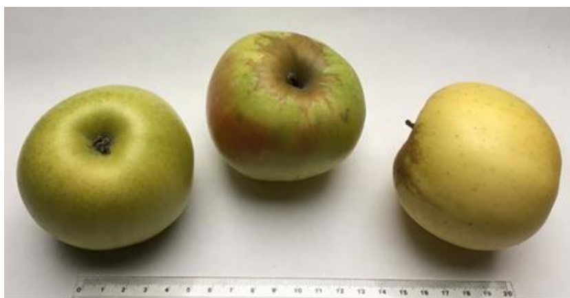
Figure 3 : Bondy Blanc

La Belle de Pontoise a été obtenue à Pontoise en 1869. C'est une très grosse et belle pomme d'automne, à chair blanche et acide qui est excellente en crumble.