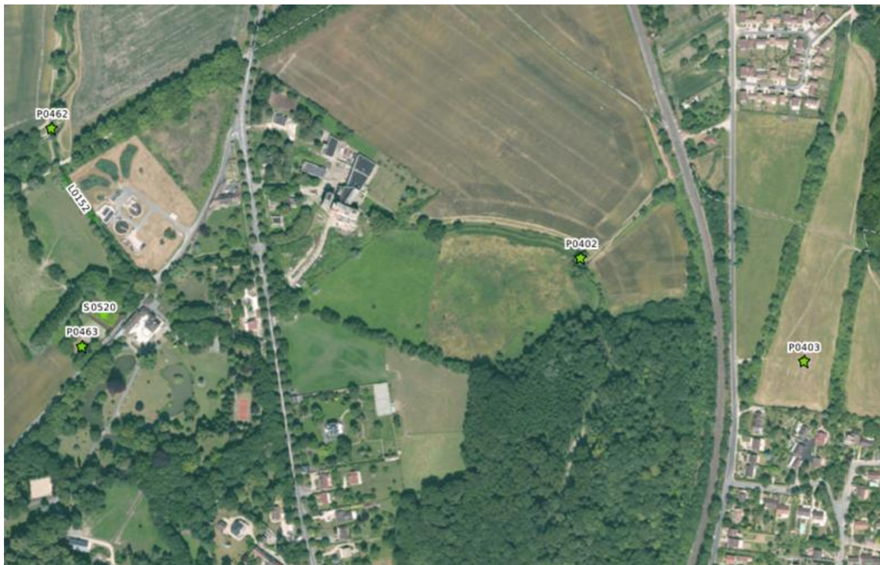
CARTE N°4 DES SITES DE L'INVENTAIRE