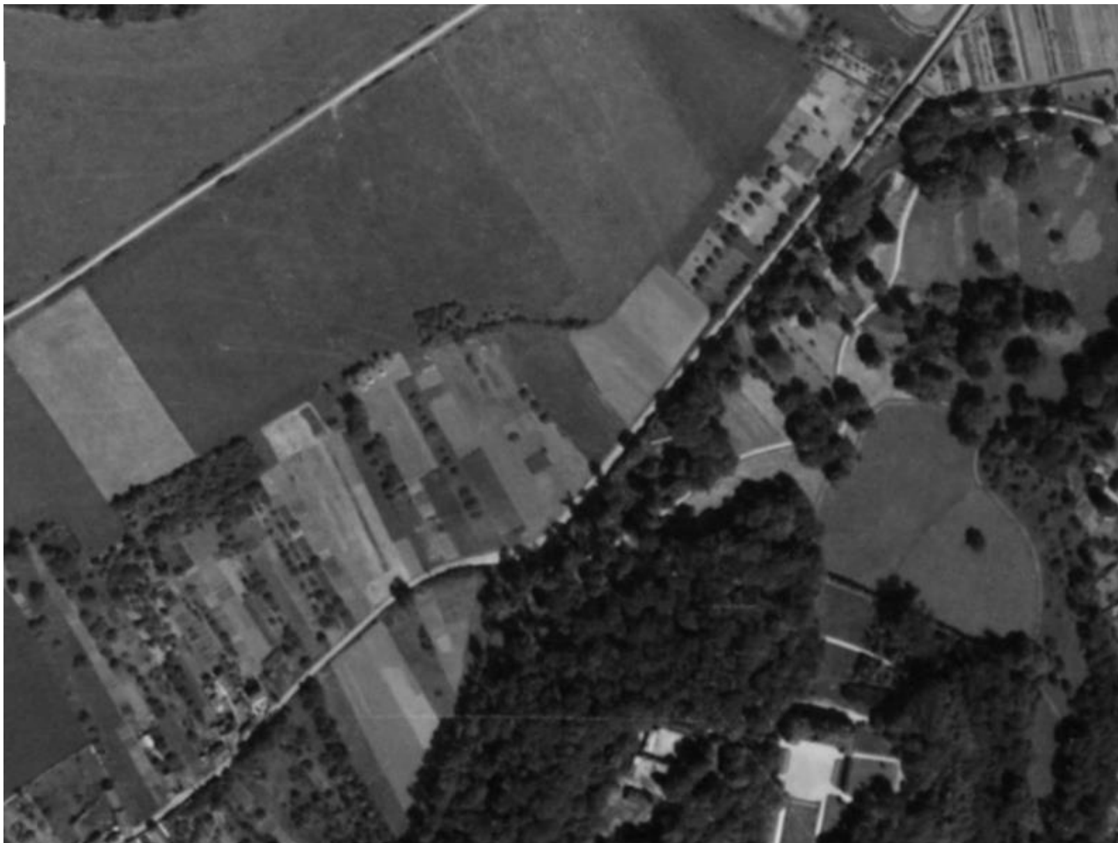
Figure 12 : Les Sablons en 1949