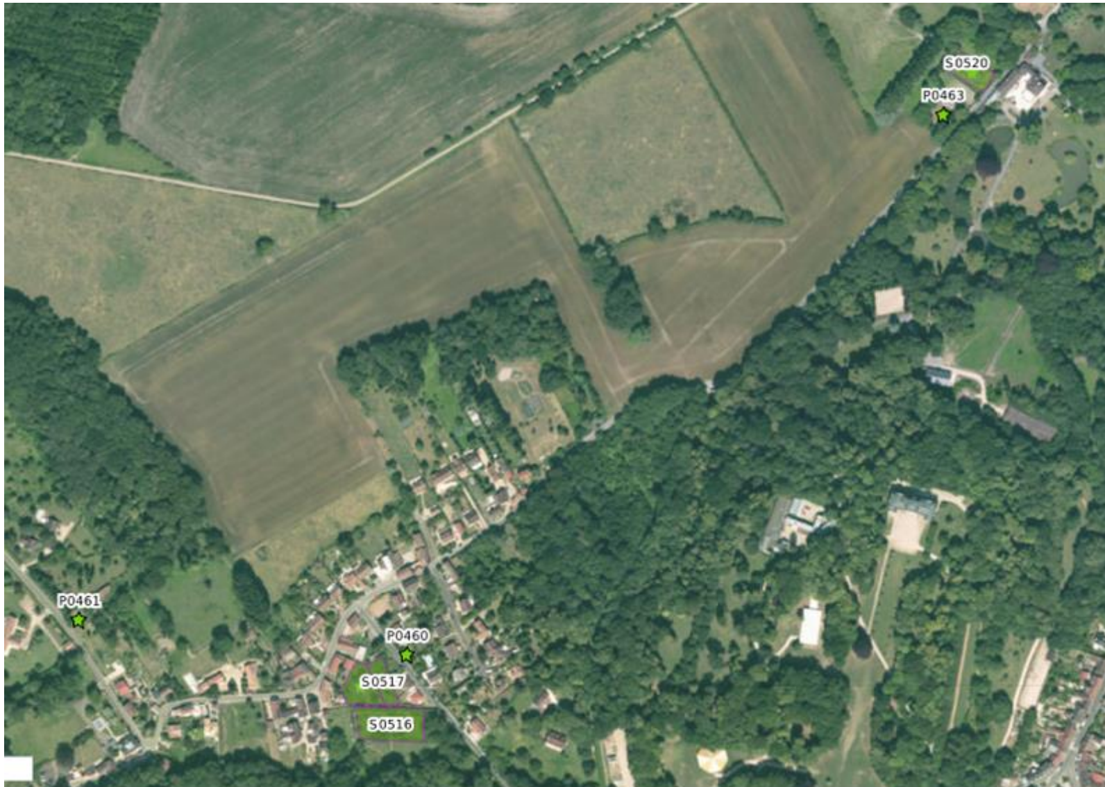
CARTE N°3 DES SITES DE L'INVENTAIRE