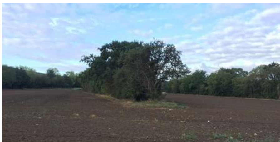
Figure 8 : Aperçu actuel d'un ancien verger aux Coutumes - S514

partie nord-ouest), c'est l'époque d'extension maximale des vergers « traditionnels » hautes-tiges et des prés-vergers 3 et probablement aussi l'apogée de la production et de la consommation de cidre dans notre région.