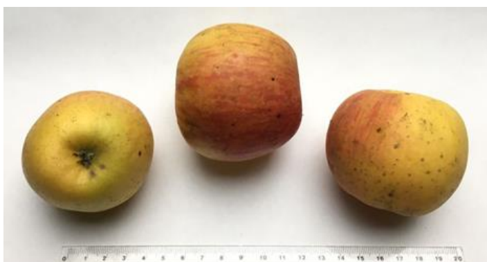
Figure 4 : Royale d'Angleterre

Originaire de la Sarthe, la Reinette du Mans est une pomme de longue conservation à plusieurs fins. Bonne crue lorsqu'elle est bien mûre, elle est excellente en pâtisserie, ou pour accompagner le boudin. Elle donne également un bon jus de pomme.