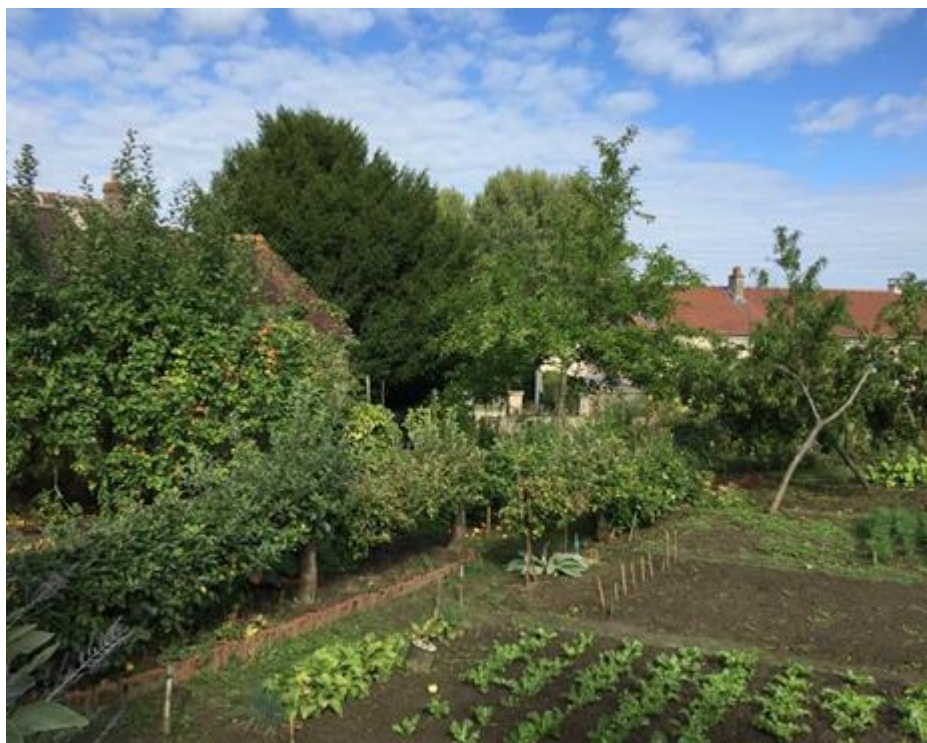
Figure 2 : Jardin potager planté d'arbres fruitiers variés – S518

Sur le plateau au sud de Presles, on rencontre quelques vestiges d'anciens vergers devenus des bois (S513, S514, S515).