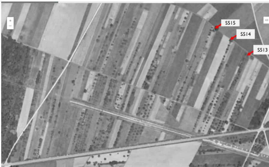
Figure 7 : Les Coutumes de Presles en 1949

Les premières photos aériennes de Presles consultables sur le site remonterletemps.ign.fr datent de 1933. Elles sont d'assez bonne qualité et permettent de voir que les arbres fruitiers étaient surtout