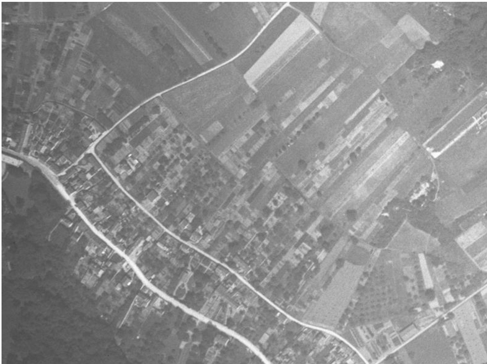
Figure 10 : Courcelles en 1933