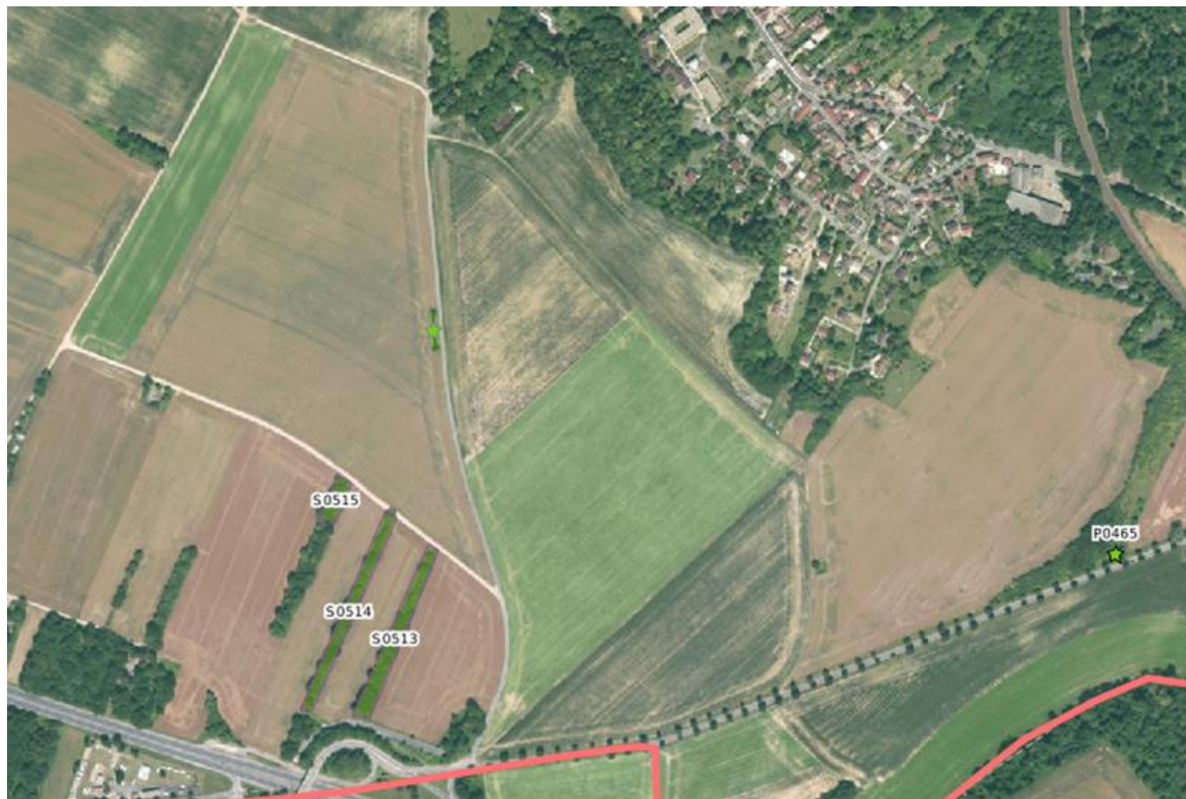
CARTE N°2 DES SITES DE L'INVENTAIRE